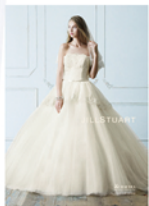
1. フロントはシンプルながら、ペプラムシルエットでスタイルアップが叶うプリンセスドレスは多くの女性を魅了。